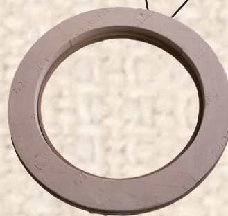
OASIS® NATUREBASE® BIO Ring