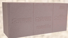
OASIS® NATUREBASE® BIO Blok