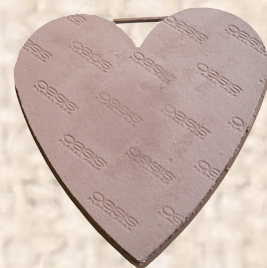
OASIS® NATUREBASE® BIO Hart